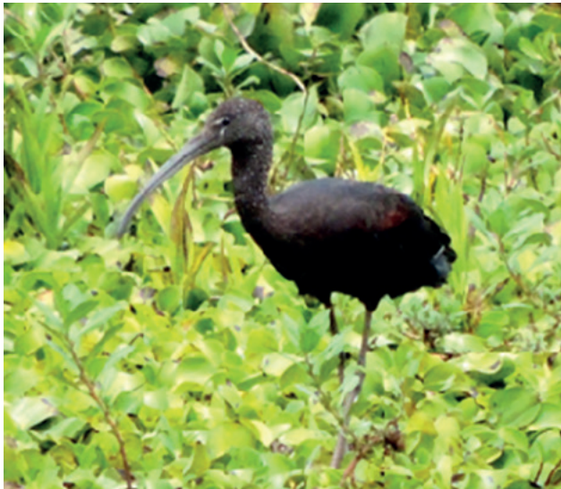
Figura 1. Ibis pico de hoz registrado en la laguna de Fúquene (Cundinamarca, Colombia).

Eichhornia sp., Limnobium sp., Typha sp., Azolla sp., Schoenoplectus sp. y Lemna sp. Las actividades de observación se iniciaron a las 06:30 hasta las 16:00 con un recorrido en lancha cuya duración fue de cuatro horas; posteriormente se realizó un recorrido a pie hasta el nacimiento del río Suárez con una duración de tres horas. Se delimitaron radios de punto fijo de 100 metros y un tiempo de observación de 15 minutos. La laguna de Fúquene es uno de los pocos relictos del sistema original de pantanos y humedales propios de la región Andina. Así mismo, constituye uno de los cuerpos de agua más grandes de los departamentos de Cundinamarca y Boyacá sobre la vertiente occidental de la cordillera Oriental (CAR 1965, Vidal y Andrade 2007), además de ser un ecosistema estratégico como hábitat de diversas poblaciones de aves asociadas a este tipo de ecosistema tales como el rascón andino ( Rallus semiplumbeus ), el cucarachero de Apolinar ( Cistothorus apolinari apolinari ) y el avetorillo bicolor ( Ixobrychus exilis bogotensis ) (Borrero 1952, ABO 2000, Renjifo et al. 2002).